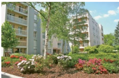
Résidence Les Erables à la Madeleine, Chartres.

Pour maintenir l'attractivité des immeubles et des résidences constituant son patrimoine, C'Chartres habitat procède à des travaux d'entretien, d'amélioration et de réhabilitation réguliers.