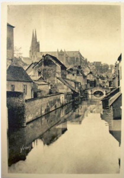
Bords de l'Eure.

L'Office gère 71 logements et emploie 5 salariés.