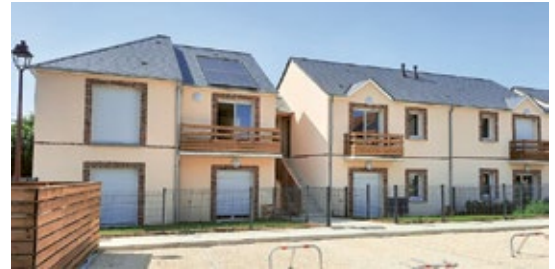
Programme C'Chartres habitat à Mignéres.

Ces constructions contribuent notamment au renouvellement urbain : celui du quartier des Clos, en cours, et celui de La Madeleine, qui démarre.