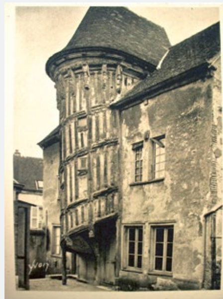
Escalier de la Reine Berthe.