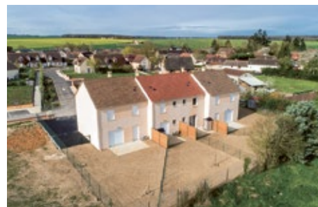
Quatre logements à Dangers.

Des aménagements de grande ampleur ont notamment été entrepris pour améliorer la performance énergétique des bâtiments, et donc le confort thermique des locataires.