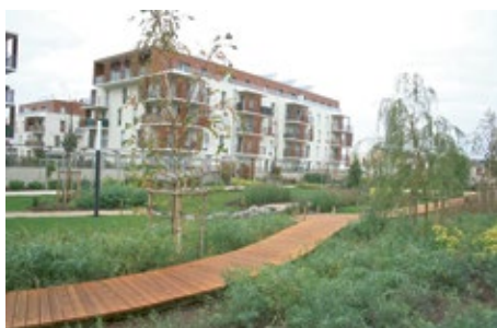
Le Parc des Pâtières, livré en 2011 en limite de Chartres et Lucé, compte 84 logements.

Les acquisitions réalisées par C'Chartres habitat au sein d'ensembles immobiliers de plus grande envergure permettent de faire cohabiter les logements publics et privés, les logements locatifs et d'autres destinés à de l'accession à la propriété, dans un objectif de mixité sociale.