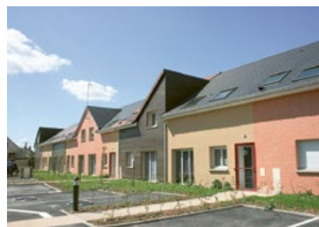
La Croix Bonnard, Chartres.