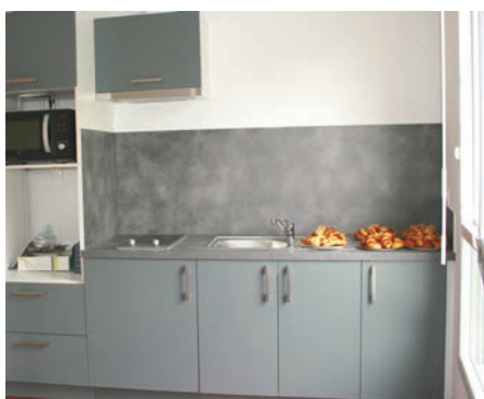
La salle commune est équipée d'une kitchenette.