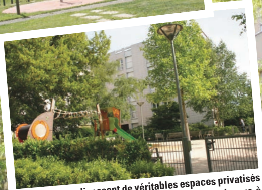
Les locataires disposent de véritables espaces privatisés et végétalisés avec jeux d'enfants comme ci-dessus à Beaulieu et à La Madeleine.