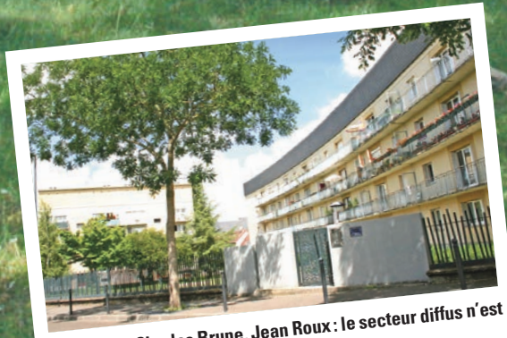
Béthouard, Charles Brune, Jean Roux : le secteur diffus n'est pas en reste.

Il y a dix ans, entre le 27 mars et le 20 avril 2007, 17 résidences étaient inaugurées sur le parc de Chartres Métropole Habitat : à Beaulieu dans le cadre de la rénovation urbaine, mais aussi à la Madeleine, Béthouard, Jean Roux, Charles Brune. Depuis, la végétation a pris sa place, les clôtures ont disparu derrière les lauriers palmes. Chaque année, aux beaux jours, les résidents profitent des espaces aménagés à l'intérieur des résidences, à l'ombre des grands arbres.