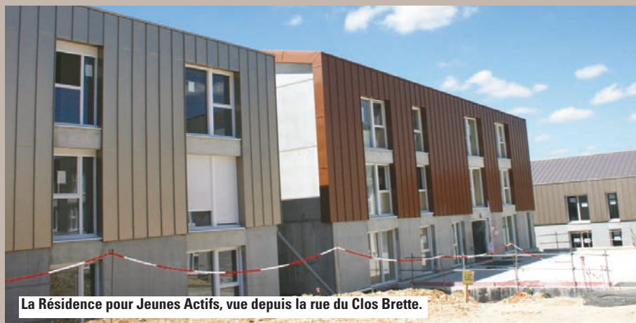
La Résidence pour Jeunes Actifs, vue depuis la rue du Clos Brette.