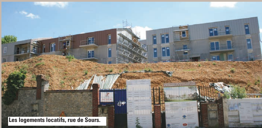
Les logements locatifs, rue de Sours.

Deux autres immeubles comprenant 37 logements sont en cours de construction et seront destinés au secteur privé.