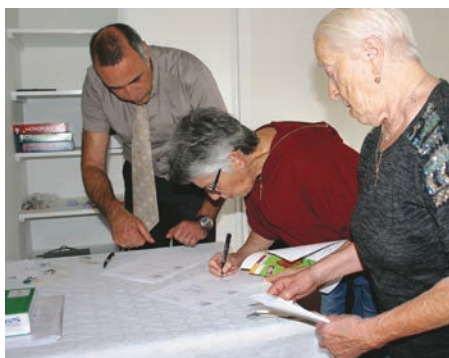
Remise des badges lors de la réunion d'information.

Elles organiseront notamment un sondage auprès de leurs voisins qui n'ont pu se rendre à la réunion, afin de recueillir leurs souhaits d'animations et les communiquer à leurs interlocuteurs du Ccas. ■