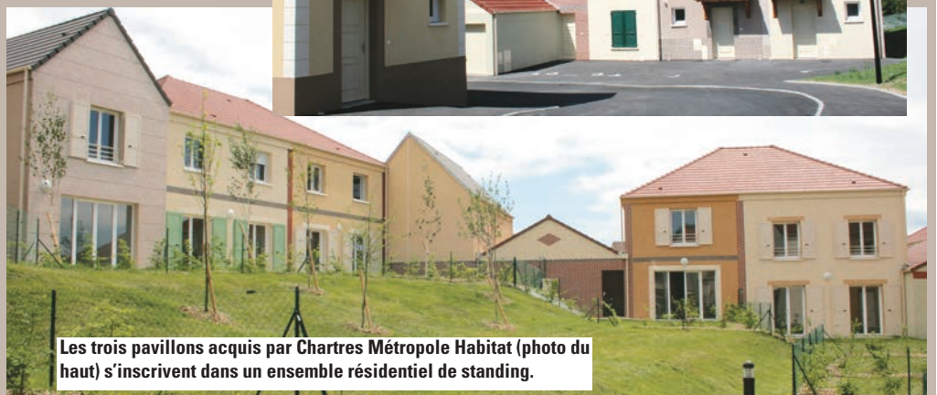
Les trois pavillons acquis par Chartres Métropole Habitat (photo du haut) s'inscrivent dans un ensemble résidentiel de standing.