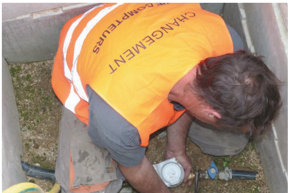
Changement d'un compteur d'eau.

trielles et ne seront plus basées sur des estimations mais sur votre consommation d'eau réelle.