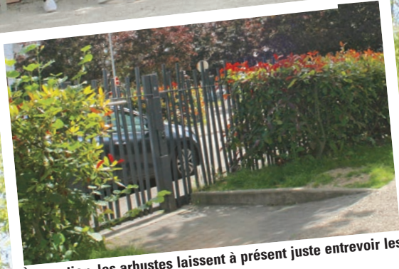
À Beaulieu, les arbustes laissent à présent juste entrevoir les clôtures.