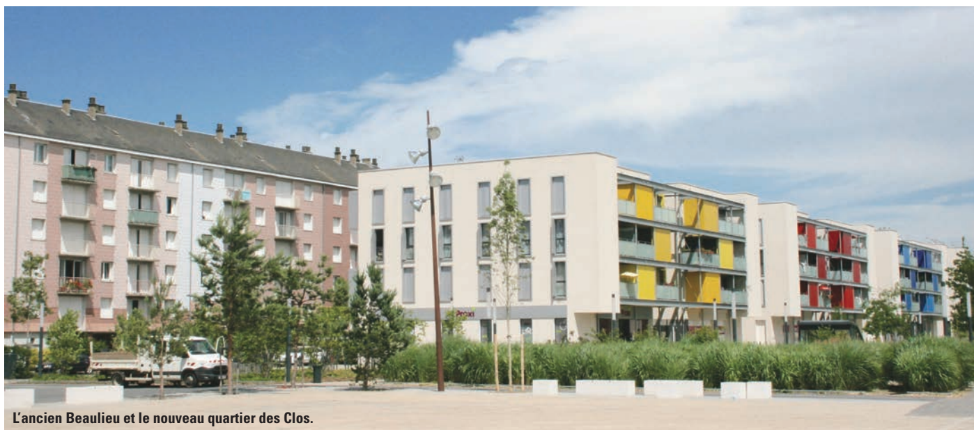
L'ancien Beaulieu et le nouveau quartier des Clos.