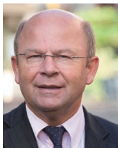
Jean-Pierre Gorges Président de Chartres Métropole Habitat Maire de Chartres