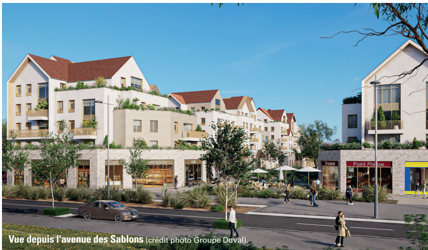
Vue depuis l'avenue des Sablons.

Le démarrage des travaux est prévu pour juin 2023. ■