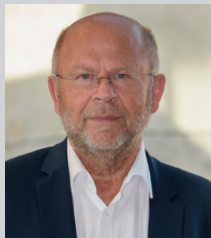
Jean-Pierre GORGES Président de Chartres Métropole Habitat Président de Chartres Métropole Maire de Chartres