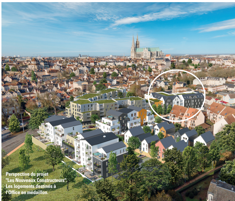
Perspective du projet "Les Nouveaux Constructeurs" Les logements destinés à l'Office en médaillon.

Livraison prévisionnelle: 1er semestre 2025. ■