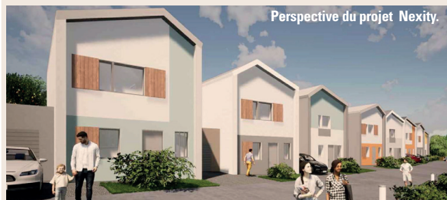
Perspective du projet Nexity.

Chartres Métropole Habitat va acquérir 6 pavillons sur les 9 qui vont être édifiés rue Trubert, dans le quartier de La Roseraie. Ils font partie intégrante du programme immobilier La Rosa Residenza en cours de construction. Il s'agit de pavillons de types IV, accolés et implantés en léger décalage.