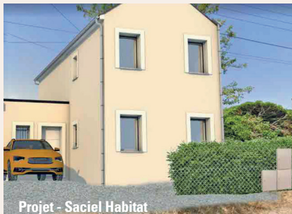
Projet - Saciel Habitat

La toiture sera dotée de panneaux photovoltaïques côté sud. ■