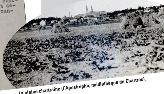
La plaine chartraine (l'Apostrophe, médiathèque de Chartres).

"Chartres habitat - 90 ans à votre service" EXPOSITION PERMANENTE D'AVRIL À DÉCEMBRE 2014 DANS LES LOCAUX DE CHARTRES HABITAT, 23 RUE DES BAS BOURGS À CHARTRES.