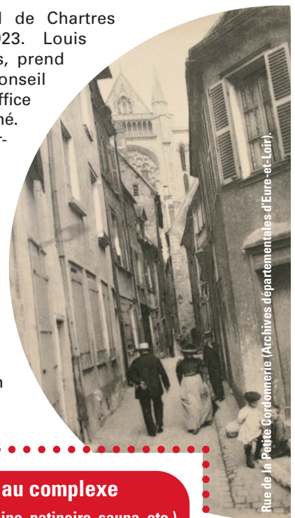
Rue de la Petite Cordomerie

La première réunion du Conseil d'Administration de l'Office s'est tenue le 6 octobre 1924. Le siège social est fixé à la Mairie de Chartres. Il est procédé à l'installation des 18 membres du Conseil d'Administration et à l'élection de son Président, Maurice Vidon (Maire de Chartres de 1925 à 1929).